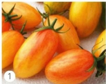
1 - Blush

Nouvelle variété de tomate allongée bigarrée de couleur jaune, rayée de rouge. Aussi belle que bonne. Excellente conservation.