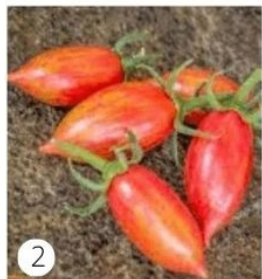
2 - Pink Tiger

Nouvelle variété de tomate allongée bigarrée de couleur jaune, rayée de rouge. Aussi belle que bonne. Excellente conservation.